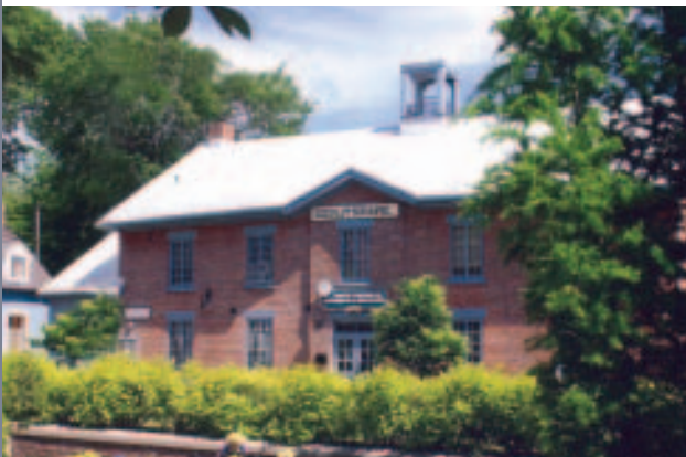
Vieux marché de La Prairie

Situé en bordure du fleuve Saint-Laurent, devant les rapides de Lachine, le Récré-O-Parc offre un accès exceptionnel à la nature, à la pratique d'activités en plein air et à une plage pour la baignade. Ce lieu de villégiature au décor enchanteur et riche en histoire représente un fort potentiel de développement culturel et touristique. Il offre des sentiers en nature et de nombreux espaces propices à l'organisation d'activités et d'événements.