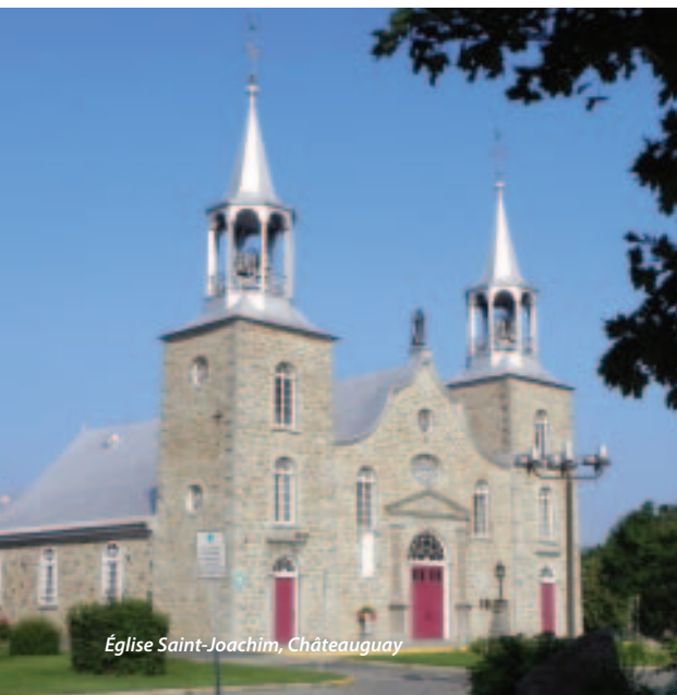
Église Saint-Joachim, Châteauguay

Ces organisations mobilisent leurs membres à travers plusieurs activités telles que des expositions, des concours, des vernissages et des ateliers-conférences. Les collectifs se joignent également à l'organisation de divers événements afin de bonifier la programmation des activités.