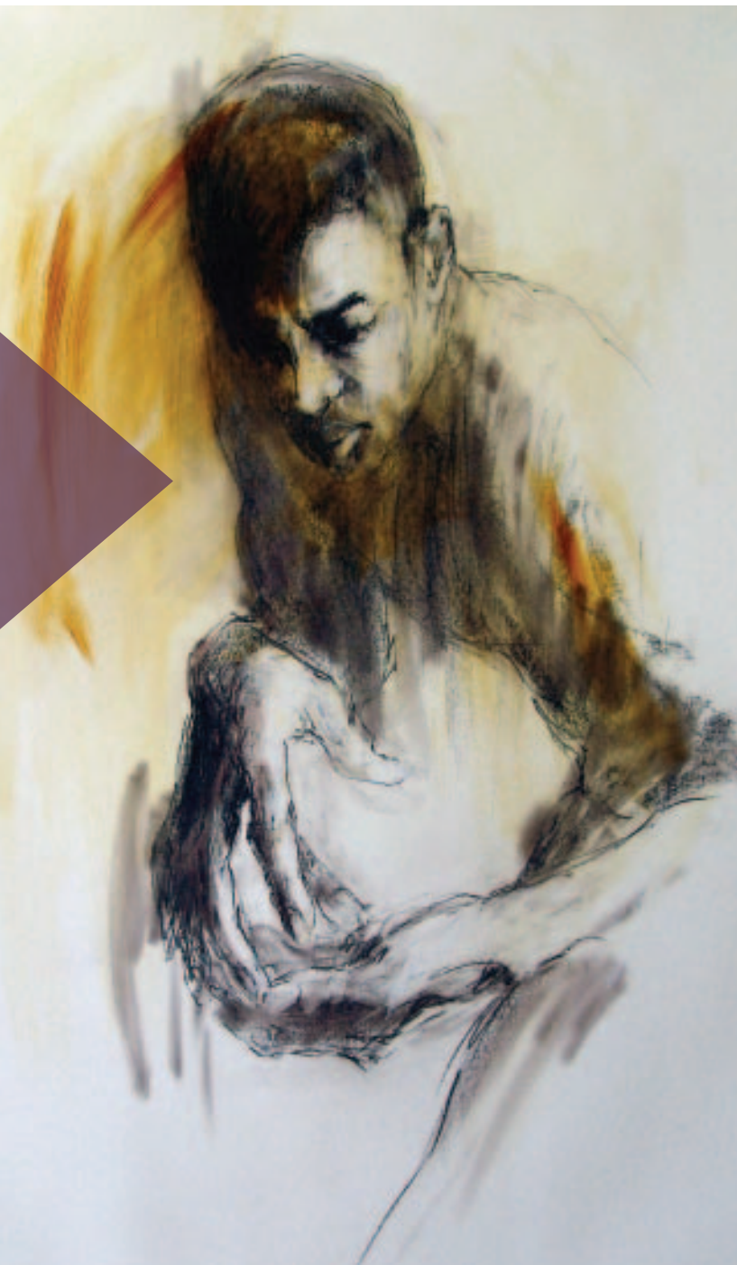
One, 2007, Beata Tyrala