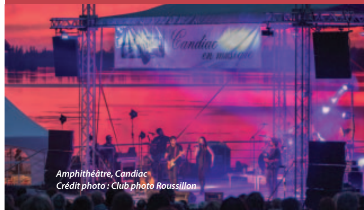
Amphithéâtre, Candiac

Les bibliothèques municipales sont des acteurs indispensables pour les communautés et offrent à tous un accès démocratique à l'information sur tous les sujets. Grâce aux nouvelles technologies, la bibliothèque étend son accès et propose maintenant des services et des activités à distance, à l'extérieur de ses installations.