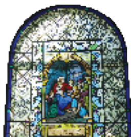
Vitrail de l'église de Saint-Mathieu

De ce nombre figure, l'église de Saint-Mathieu, la Maison LePailleur (Châteauguay), la Maison Page (Candiac) et le site des Anciens-Presbytères-de-Saint-Constant.