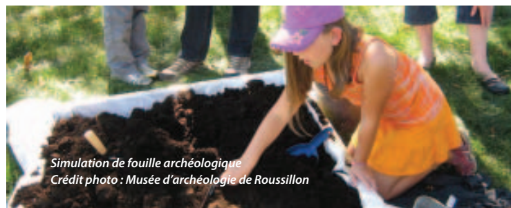
Simulation de fouille archéologique

Toutefois, plusieurs des sites archéologiques identifiés sont peu documentés. La réalisation d'une étude de potentiel archéologique régionale pourrait améliorer l'état des connaissances et doter les municipalités d'un outil apte à faciliter leur démarche de planification et de développement du territoire. Les noyaux villageois, les rives des cours d'eau et les axes routiers anciens peuvent s'avérer d'un grand intérêt historique et archéologique.