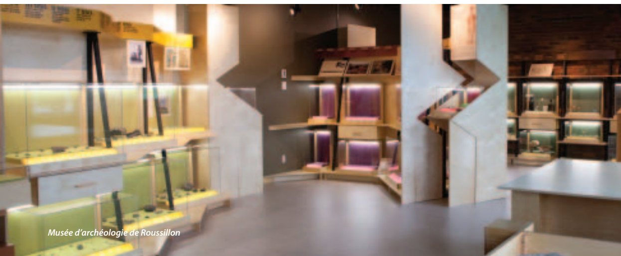
Musée d'archéologie de Roussillon

Cet effort soutenu de la part de l'ensemble de la région a permis la mise en commun des ressources. Ainsi, le Musée agit à titre d'expert-conseil auprès des villes et des organismes du territoire en matière de prévention, de protection, de recherche et de mise en valeur des ressources archéologiques. Ce service favorise une meilleure planification des aménagements réalisés dans les zones à fort potentiel archéologique et permet le développement de projets de mise en valeur du patrimoine régional.