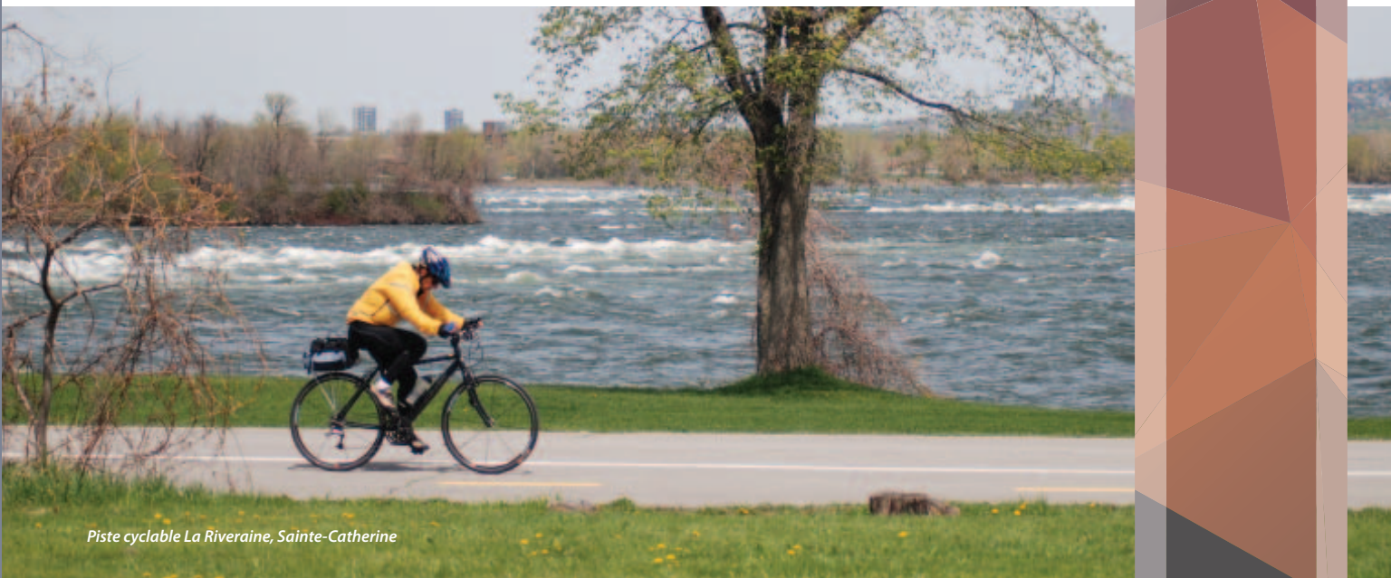
Piste cyclable La Riveraine, Sainte-Catherine

La réalisation d'un important programme d'aménagement urbain a permis d'ajouter au charme du lieu tout en mettant en valeur son histoire et les découvertes archéologiques réalisées. Le Musée d'archéologie de Roussillon, situé au cœur du quartier, convie la population à découvrir l'importante collection archéologique de la région. Il propose aussi une programmation d'activités et d'expositions diversifiée et adaptée à tous les publics. La Société d'histoire de La Prairie-de-la-Magdeleine offre de son côté des ateliers de généalogie, des conférences et des visites guidées du quartier. Plusieurs restaurants et boutiques animent le Vieux-La Prairie.