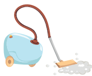
Poussière, sacs d'aspirateur et charpie de sècheuse