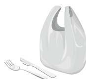
Plastiques et polystyrènes