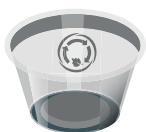
Vaisselle et contenants compostables