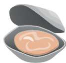
Coquilles d'huître et de moule