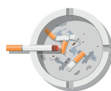
Mégots et cendres de cigarette