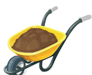
Terre, roches, cailloux et pierres